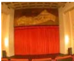
Auditorio Aurelio Guirao