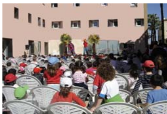
Biblioteca -Terraza de actividades