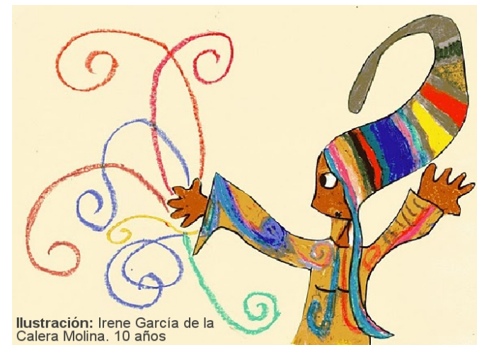
Ilustración: Irene García de la Calera Molina. 10 años